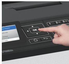
월 최대 출력 300,000매

Network를 통해 다양한 문서를 빠르게 출력할 수 있으며, USB 포트를 활용하면 PC 없이도 PDF 문서와 이미지 파일의 출력력이 가능합니다.