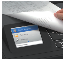
양면인쇄 기본 장착

2.4인치의 컬러 디스플레이가 장착돼 프린터 상태를 직관적으로 확인할 수 있어서 매우 편리합니다.