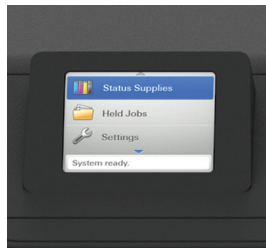
2.4" Color LCD Display

2.4인치의 컬러 디스플레이가 장착돼 프린터 상태를 직관적으로 확인할 수 있어서 매우 편리합니다.