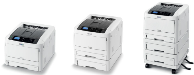
CL3093dn CL3093dtn 급지대 옵션 최대 장착