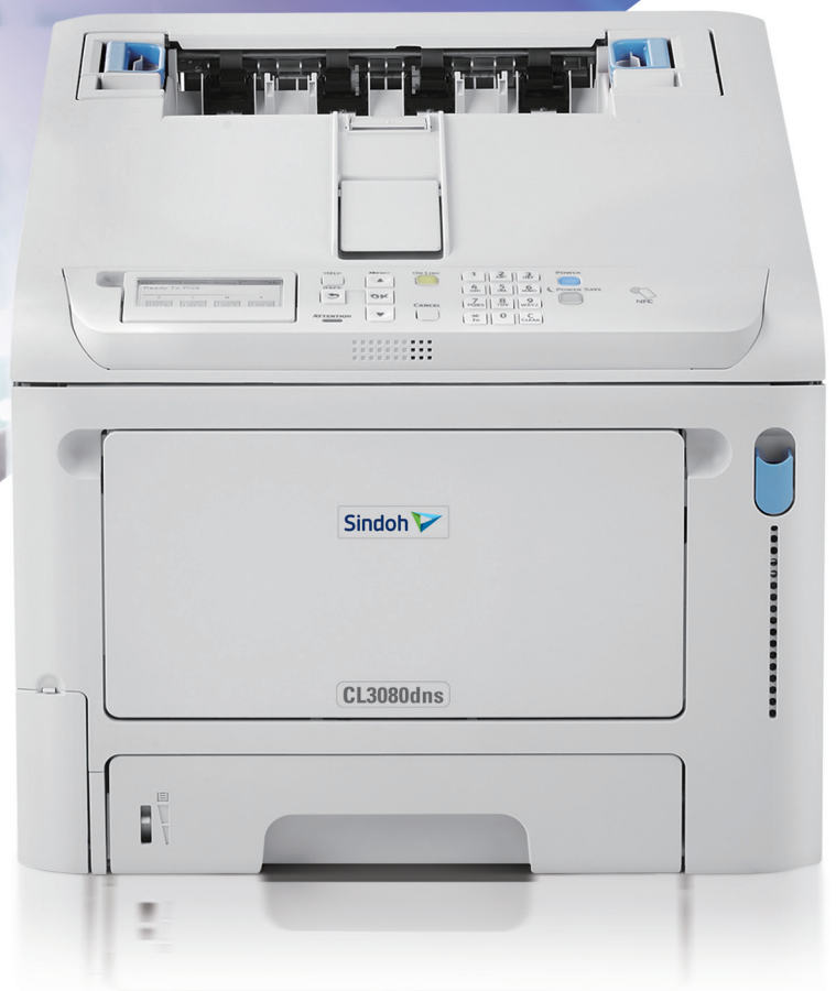
| CL3080dns |