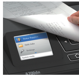
양면인쇄 기본 장착

2.4인치의 컬러 디스플레이가 장착돼 프린터 상태를 직관적으로 확인할 수 있어서 매우 편리합니다.