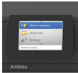
2.4" Color LCD Display

2.4인치의 컬러 디스플레이가 장착돼 프린터 상태를 직관적으로 확인할 수 있어서 매우 편리합니다.