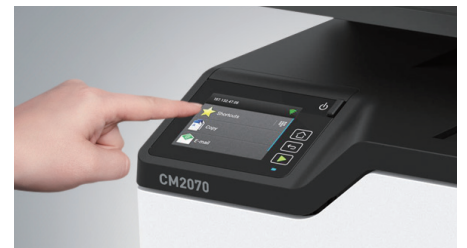
2.8인치 컬러 터치 스크린

CMYK 색상별 토너/드럼 일체형 카트리지로 소모품 교체의 번거로움을 최소화하였고, 비용도 분리형 제품에 비해 경제적입니다.