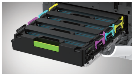
토너/드럼 일체형 카트리지

250매 급지대를 2개까지 연결할 수 있어 업무 맞춤형 용지 급지가 가능합니다.